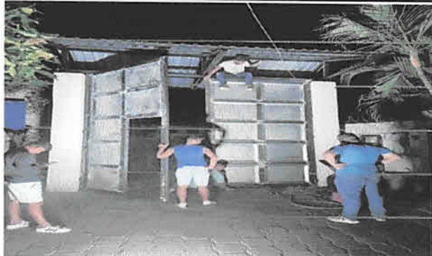
FOTO 9: SE CABIARÁ EL PORTÓN PRINCIPAL YA QUE SE ENCUENTRA DETERIORADO