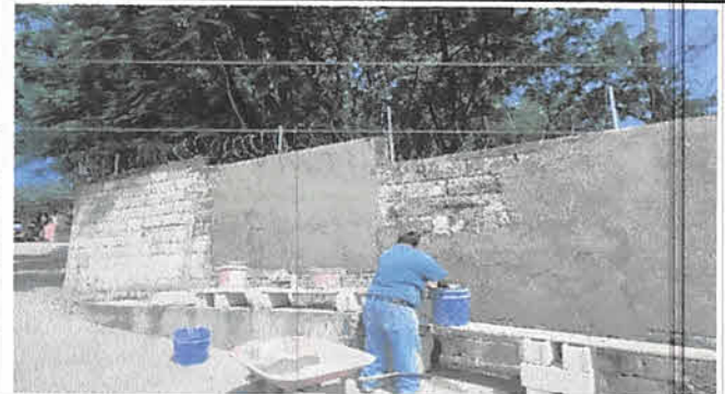
FOTO 10: EXTRA 30 METROS CUADRADOS DE ENSABIETADO EN TAPIAL PERIMETRAL