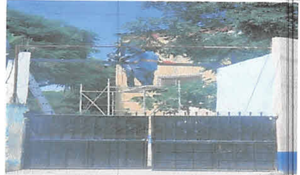
FOTO 8: SE COLOCARÁ TECHO SOBRE EL PORTÓN DE LA ENTRADA PRINCIPAL