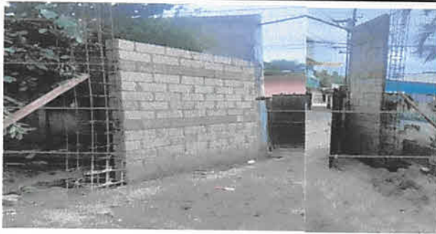
FOTO 7: SE REALIZARAN 2 COLUMNAS Y SE LEVANTARAN 2 PAREDES PARA MOVER EL PORTÓN HACIA ADETRÁS