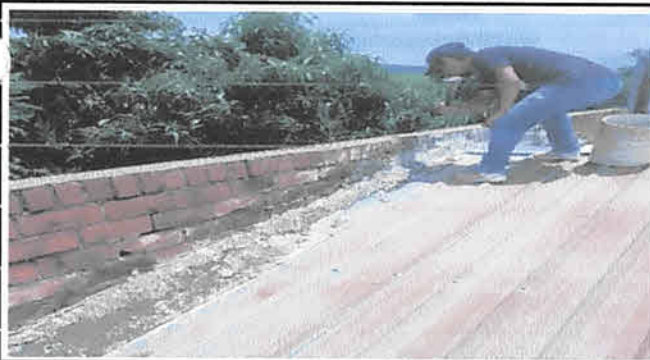
FOTO 11: REMOVER BORDILLO EN LAMINA DE TECHO Y APLICAR NUEVO BORDILLO