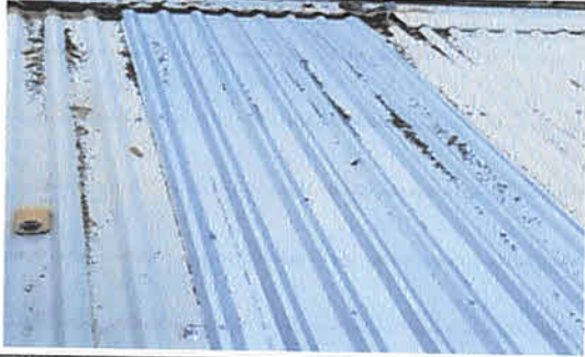
FOTO 1: CAMBIO DE UNA LAMINA DE 19 PIES EN UNA AULA DEL SEGUNDO NIVEL